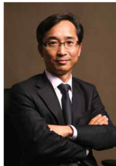
行长兼副董事长 竹田和史

作为“支持客户与社会持续发展，协助解决各项课题的最佳合作伙伴”，希望今后也能持续获得各位的支持和信赖。